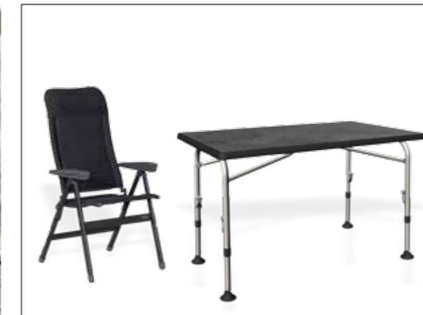
+ Tische und Stühle