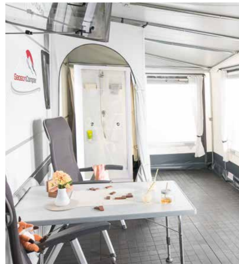
+ Duschkabine im Vorzelt, die sich diskret in einem separaten Umkleideabteil befindet