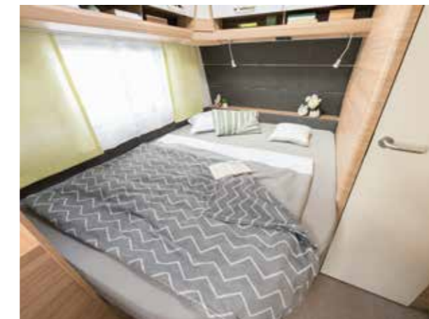
+ Im großen Doppelbett warten erholsame und ruhige Träume auf die Eltern