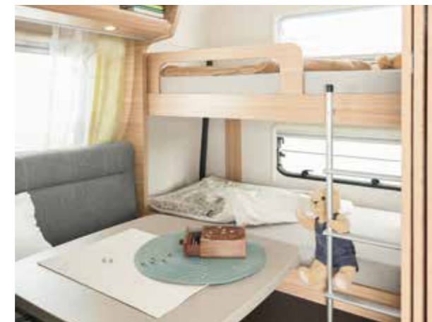
+ Die Kinder schlafen im Heck längs (wie Abb. Season Camper L) oder quer (Season Camper M), ungestört vom Elternschlafzimmer