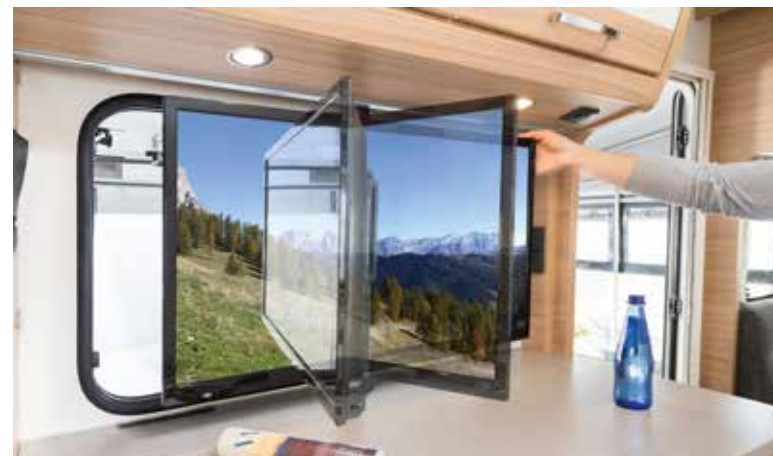
+ Ein großer 32" TFT-Flachbildschirm bietet Kino-Feeling, egal ob im Fahrzeug oder im Vorzelt, dank nach außen schwenkbarem TV-Halter (Option)