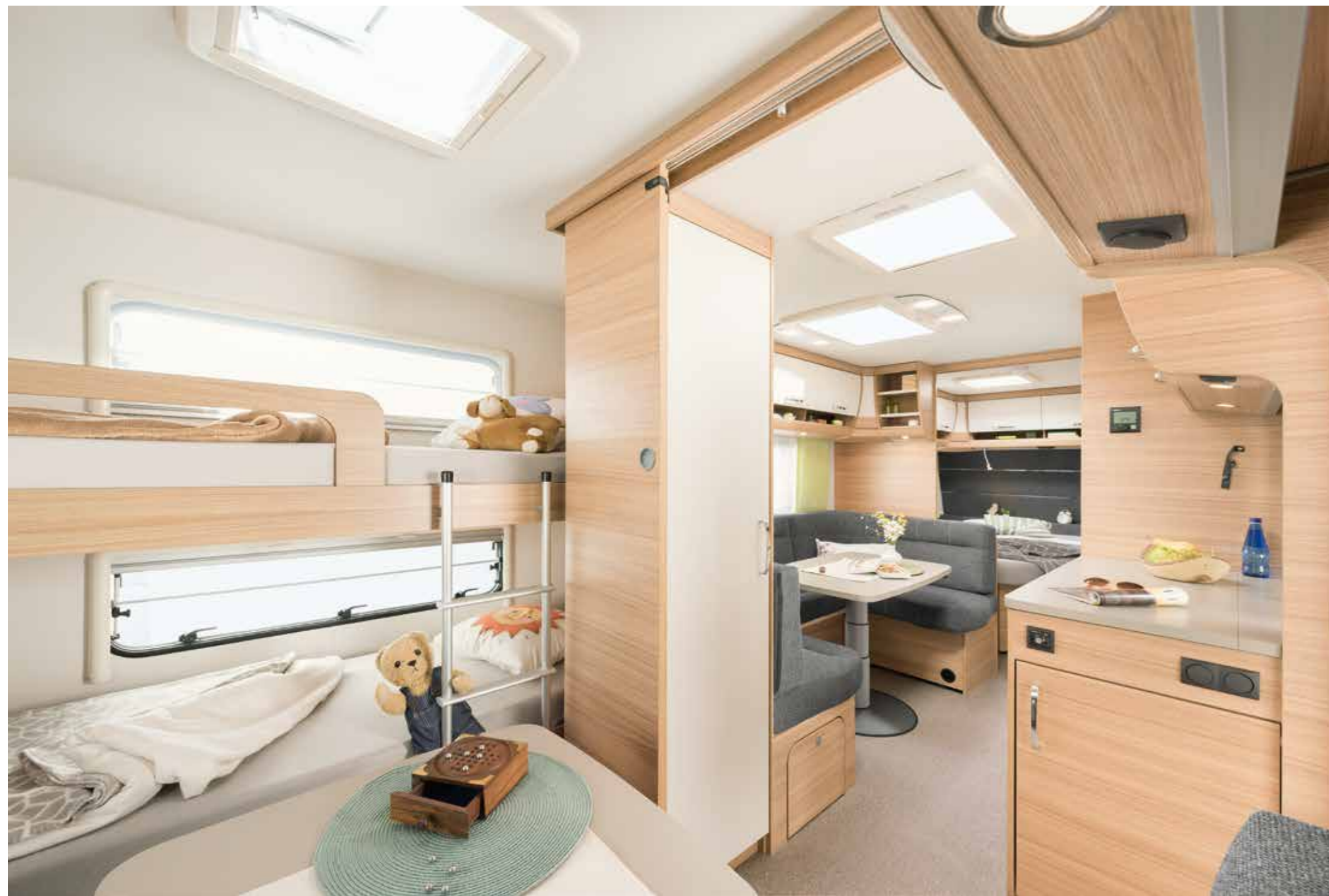
+ Season Camper L: Wohlfühl-Atmosphäre im Season Camper für die ganze Familie ist garantiert. Dafür sorgen schöne, robuste und langlebige Textilien kombiniert mit modernem Design. Die großzügig geschnittenen Grundrisse sorgen für Bewegungsfreiheit und für ein Gefühl, als wäre man zu Hause.