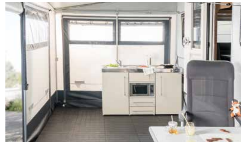
+ Küche (alternative Küchenmodule verfügbar)