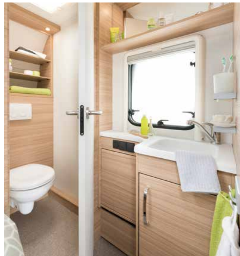
+ Haushaltsübliche Keramik-Hängetoilette angeschlossen an das Abwassersystem. Es sind hochwertige, haushaltsübliche Armaturen verbaut